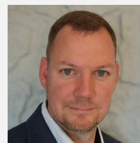
Stefan Kuhlbars Ausbildungsmanagement