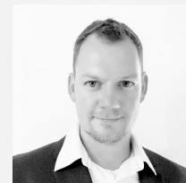
Stefan Kuhlbars Ausbildungsmanagement